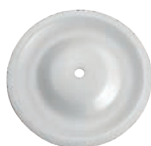
MEMBRANA Cod. PB0032